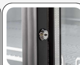
Serratura di serie