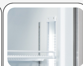
Luce interna LED verticale